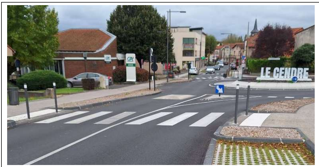
Avenue Centrale – Vue d'ensemble sur le giratoire et une traversée piétonne en entrée de giratoire

Ce projet a permis de remplacer le carrefour à feux tricolores par un giratoire afin de fluidifier la circulation en entrée de centre-ville. L'abandon des feux tricolores a permis d'améliorer les traversées piétonnes. Les passages piétons ont bien été fait aux normes PMR (dalles podotactiles, potelets avec têtes blanches, dimensions des passages).