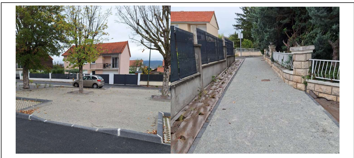
Quartier Beauséjour – Place des Dahlias – Reprise de la place et des chemins piétons

Les deux places principales ont été réaménagées pour que leur accès soit rendu accessible aux PMR (adaptation de bordures basses).