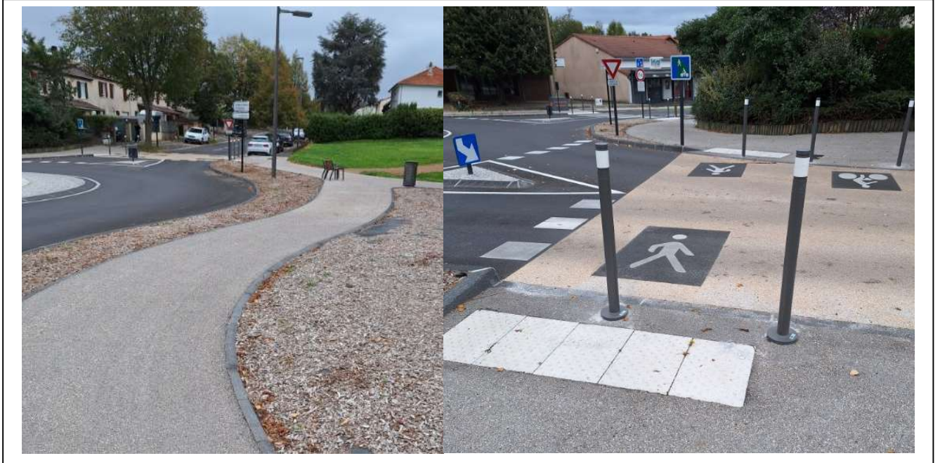
Avenue Centrale – Cheminement piéton et traversées piétonnes