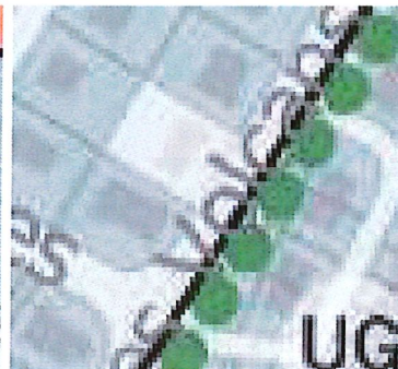
Avenue des Volcans

Pour prise en compte à l'issue de l'enquête publique.