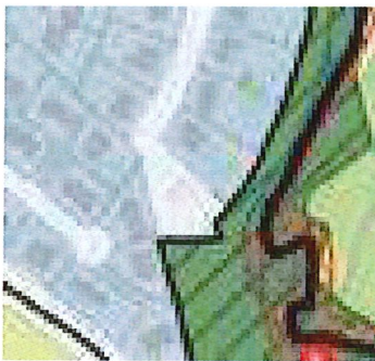
Rue du Vallon

D'autres parcelles sont concernées rue du Patural et avenue des Volcans comme le décrit les extraits ci-dessous.